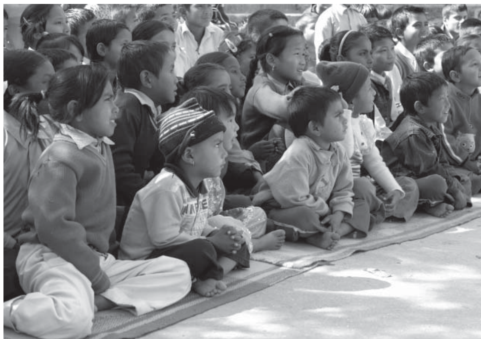
Ein Clown aus Schweden zu Gast in unserer Schule